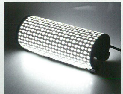
Bi-Color für warmes Licht und Tageslicht