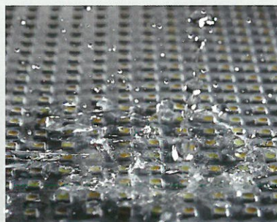
Regenschutz Schutzklasse IP64

Mit der richtigen Beleuchtung schaffen Sie die Basis für einen gelungenen Dreh. Tauchen Sie Ihr Set in warmes Stimmungslicht oder helles Tageslicht mit bis zu 4000 Lux. Helligkeit und Farbtemperatur können Sie nahezu stufenlos einstellen. Durch ihr geringes Gewicht, die solide Verarbeitung und den Regenschutz sind die Leuchten auch bei mobilen Einsätzen besonders beliebt.